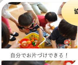
自分でお片づけできる！