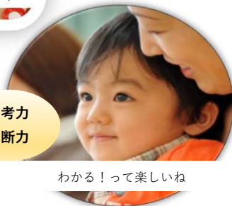
わかる！って楽しいね